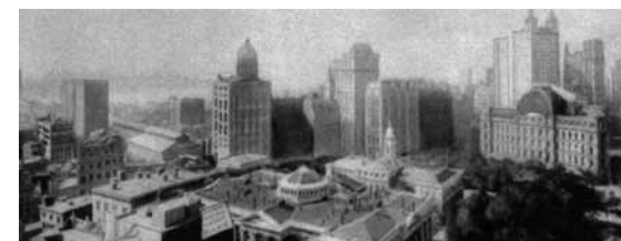
New York à la fin du XIX e siècle